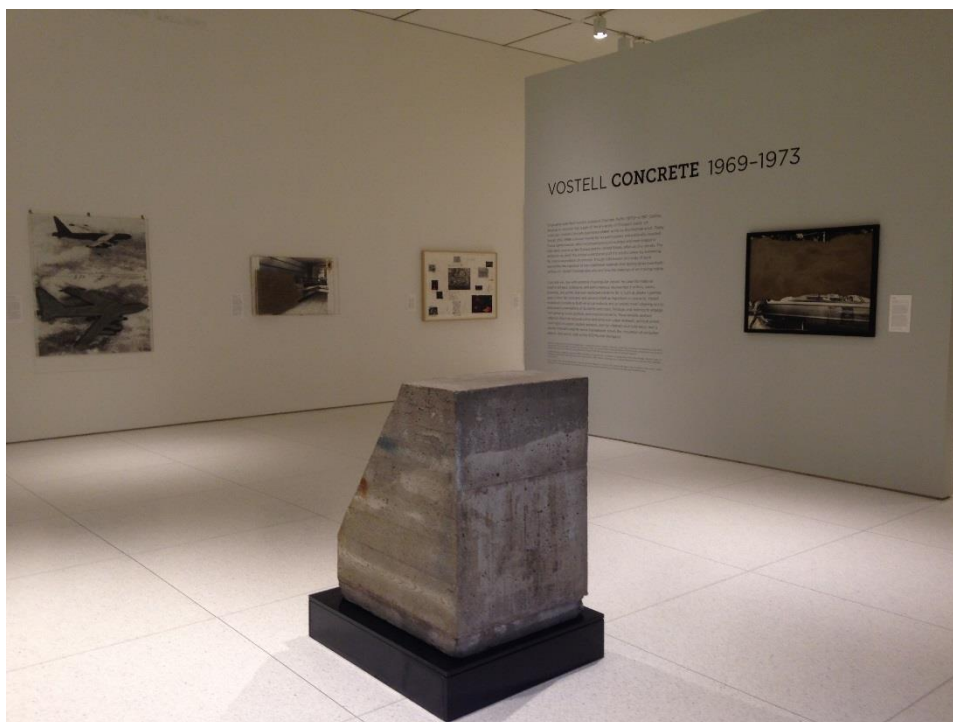
Vista de la entrada a la exposición “Vostell Concrete 1969-1973”, en SMART Museum of Art de Chicago

La exposición “Vostell Concrete 1969-1973” presentó en Chicago obras realizadas en muy diferentes medios (escultura, vídeo, collage, etc.) y una cuidada selección de fondos documentales, entre los que destacan los aportados desde el Museo Vostell Malpartida a través del Archivo Happening Vostell, propiedad de la Junta de Extremadura.