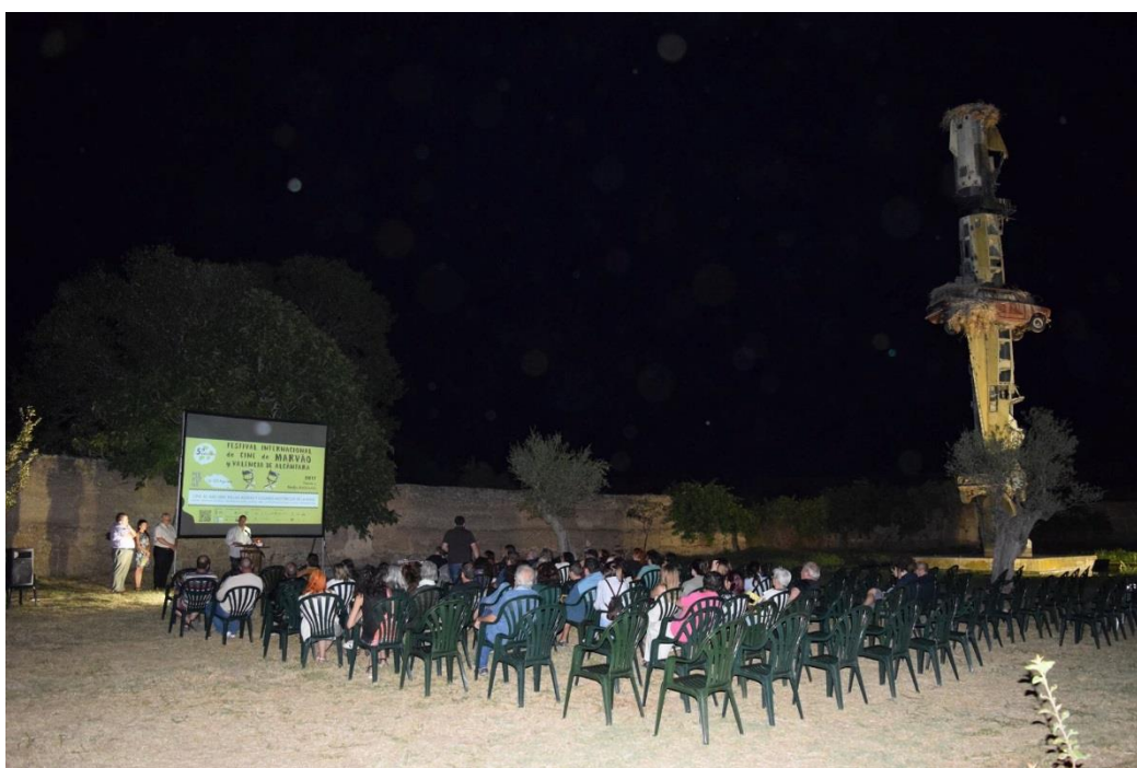
Inauguración en el Museo Vostell Malpartida de la quinta edición de "PERIFERIAS Festival Internacional de Cinema Marvão - Valencia de Alcántara"

Se proyectó el largometraje documental "Paula Rego. Histórias & Segredos", dirigido por Nick Willing.