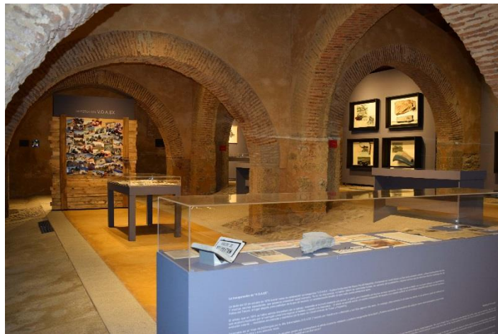
Vista general de la exposición “VOAEX. Un viaje de Wolf Vostell. 40 años de un museo sin muros” en el Museo Vostell Malpartida.

La sección de esta exposición “en proceso” y “participativa” que destacó por su singularidad fue un espacio destinado a exhibir fotografías de visitantes junto a la emblemática escultura “VOAEX”.