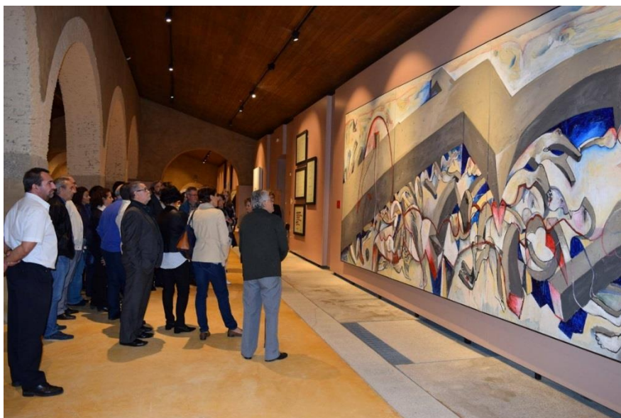
Inauguración de la exposición Wolf Vostell más allá de la catástrofe"

Con motivo de la exposición, en la que se pudieron contemplar por primera vez en Extremadura creaciones de la primera época de Vostell, y por primera vez en el museo la obra de gran formato "SHOAH 1492-1945", se publicó el libro "Wolf Vostell más allá de la catástrofe. (Arte igual a vida, vida igual a historia)", en el que se abordaron los temas del de-coll/age, el viaje, el aislamiento y el exterminio, la figura de Jesús, el cuerpo, el muro y la propia España relacionados con el concepto de destrucción.