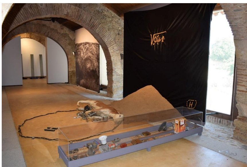
Vista de la exposición “Memoria y Anatomía del Territorio” en el Museo Vostell Malpartida