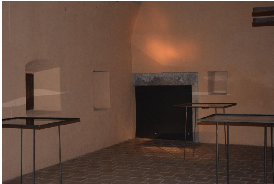
Detalle de la exposición/instalación sonora de Mikel Arce “Air, Light, Earth and Water... Whisper Vostell / El aire, la luz, la tierra, el agua... susurran Vostell”.

La sonosfera del MVM hizo vibrar agua situada sobre bandejas metálicas y produjo de este modo reflejos que fueron proyectados en las paredes de la sala conocida como “El Molino”. El artista trató las bandejas en función de su señal sonora, utilizando los colores dorado, plateado y negro como símbolos, respectivamente, de la luz-sol, el aire-viento y la tierra. Asimismo, una imagen subacuática fue proyectada en tiempo real en el techo abovedado de la sala. Surgió de un banco que permitió sentarse al visitante, por lo que se propició también una escucha corporal.