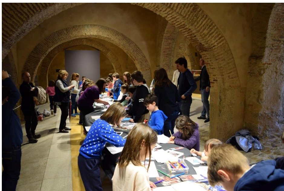
Detalle del taller creativo "El Maravilloso Mundo de los Libros de Artista"

Asimismo, se exhibió en las salas del museo una selección de libros de artista y revistas ensambladas. Estos fondos procedieron tanto del Archivo Happening Vostell como de la biblioteca del Museo Vostell Malpartida y supusieron un soporte que posibilitó situar los conocimientos prácticos adquiridos durante el taller en una tradición histórica de largo recorrido y muy heterogénea.