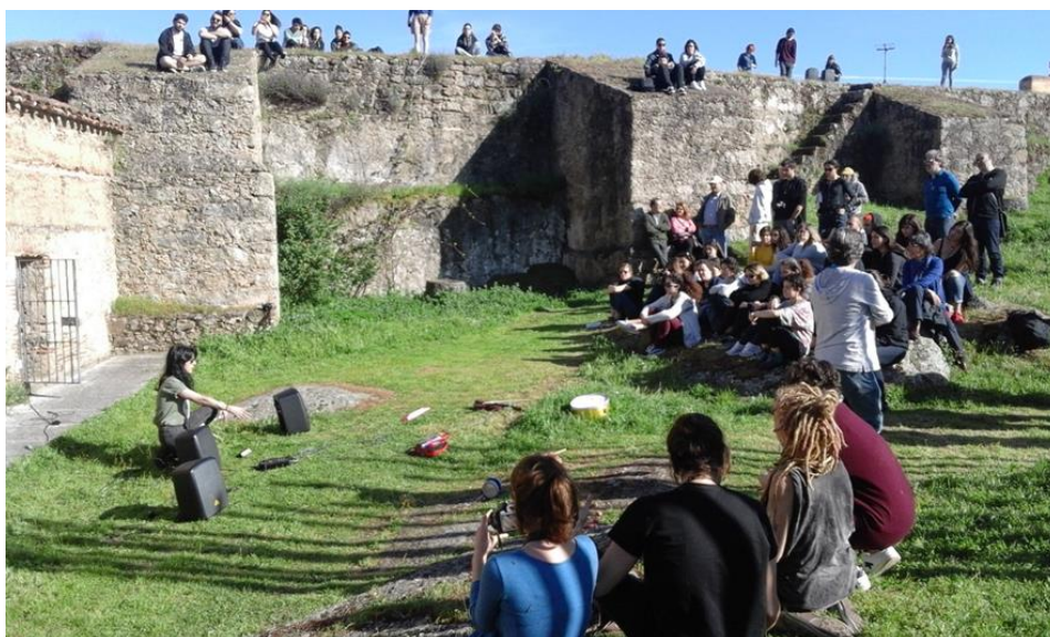
Detalle de una de las acciones e intervenciones realizadas en el Museo Vostell Malpartida por alumnos de la Facultad de Bellas Artes de la Universidad del País Vasco.

Participaron estudiantes del Grado de Arte y del Máster en Arte Contemporáneo Tecnológico y Performativo, que idearon intervenciones que respondieron a los principales rasgos de identidad del museo.