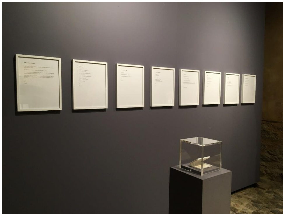
Vista de la exposición "92 Events. Ken Friedman" en el Museo Vostell Malpartida.

Para mayor conocimiento de la obra de Ken Friedman, aún poco estudiada en nuestro país, se editó una publicación de pequeño formato con la traducción al castellano de la versión original inglesa de estos "92 Events".