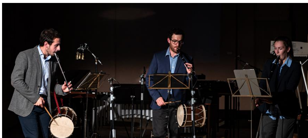
Concierto de Trío Zukan en el Museo Vostell Malpartida

En su segunda semana, el ciclo contó con la participación del percusionista noruego Ingar Zach y con la formación vasca Trío Zukan que interpretó un programa que otorgó un protagonismo notable a instrumentos tradicionales. En este concierto se produjo el estreno absoluto de una composición de Jagoba Astiazarán, que estuvo presente en el museo.