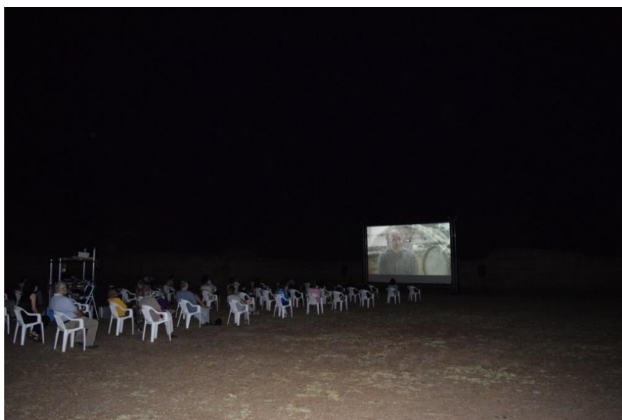
"Mundo rural y futuro posible" en el Museo Vostell Malpartida

Dichas actividades contaron con la colaboración de la Secretaria General de Cultura de la Consejería de Cultura, Turismo y Deporte de la Junta de Extremadura, el Ayuntamiento de Malpartida de Cáceres y la Cafetería-Restaurante del Museo Vostell Malpartida.