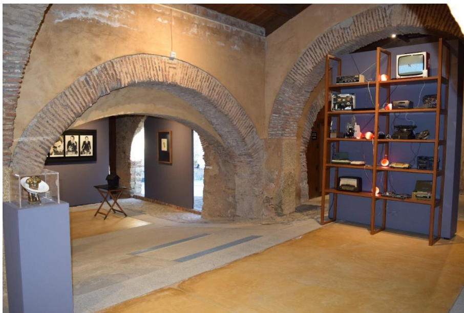
Vista de la exposición “Es el sol el que calienta la habitación” en el Museo Vostell Malpartida.

La exposición se nutrió de fondos propios del museo y de obras de colecciones privadas, entre ellas The Wolf Vostell Estate y Boris Lurie Art Foundation.