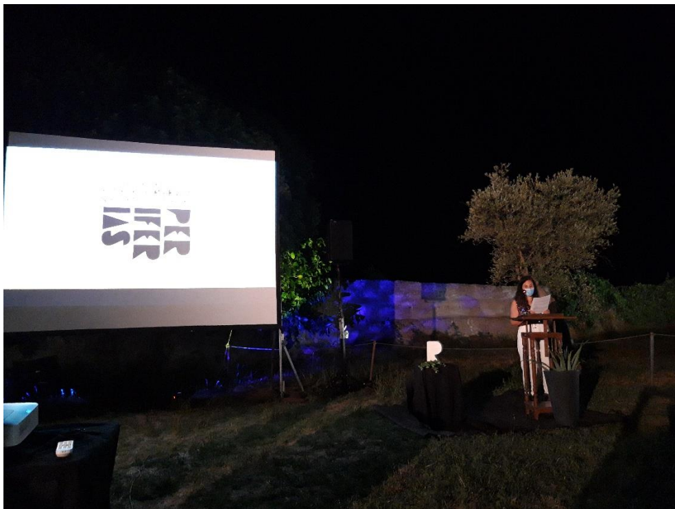
Presentación de la película "El cuadro" en el Museo Vostell Malpartida.