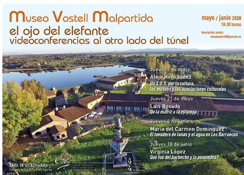
Póster de "El ojo del elefante. Videoconferencias al otro lado del túnel".

El ciclo de videoconferencias se llevó a cabo gracias a la colaboración de la Junta de Extremadura, el Consorcio Museo Vostell Malpartida y la Asociación de Amigos del Museo Vostell Malpartida.