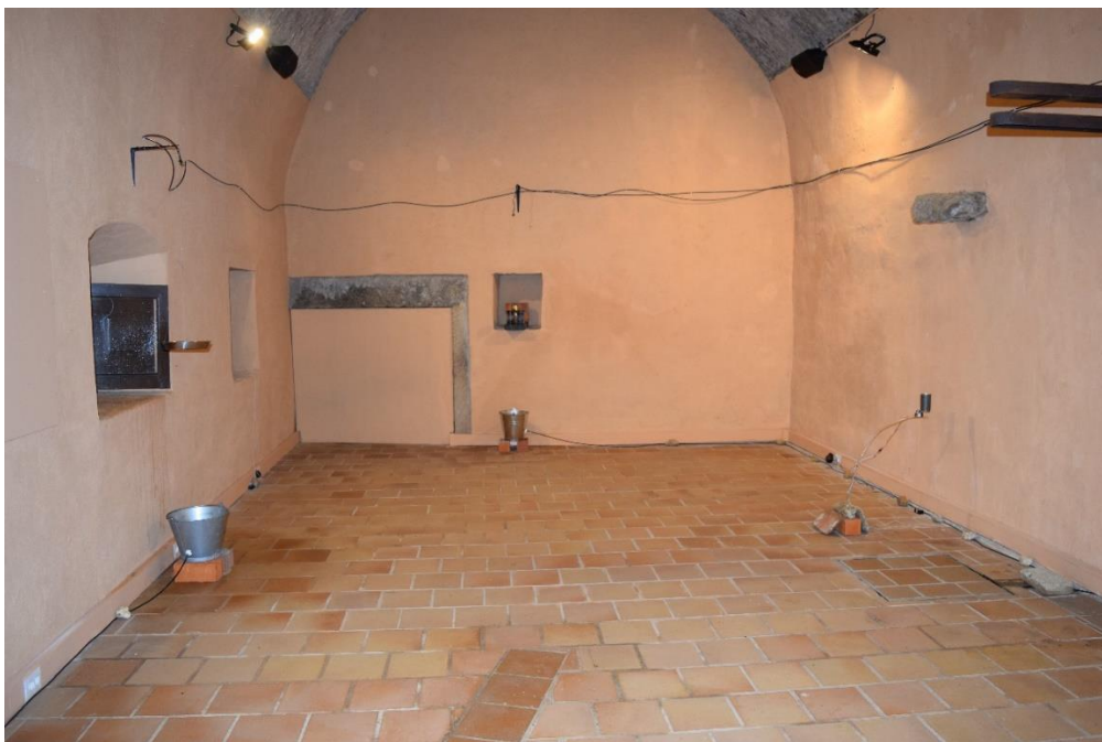
Vista general de la exposición “Dead Plants and Living Objects”, de Rie Nakajima y Pierre Berthet, en el Museo Vostell Malpartida.

Se trató de una iniciativa del Museo Vostell Malpartida y la Consejería de Cultura, Turismo y Deportes de la Junta de Extremadura, que contó con la colaboración de Fundación Japón Madrid y el organismo Wallonie-Bruxelles International.