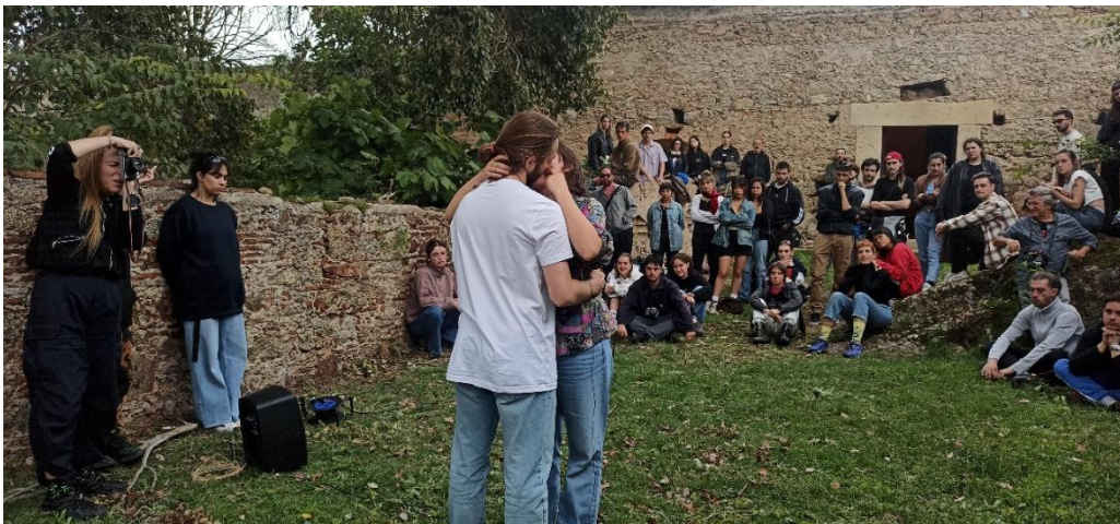
Performance de alumnos de la Universidad del País Vasco en el MVM

La obra de Wolf Vostell, junto a las colecciones y el espacio del Museo Vostell Malpartida, proporcionan los referentes para la práctica del arte sonoro, la performance y el videoarte; también en el proceso de aprendizaje de los artistas que acuden a un lugar con vocación de intercambio de conocimiento y experiencias estético-vitales como rasgo de identidad.