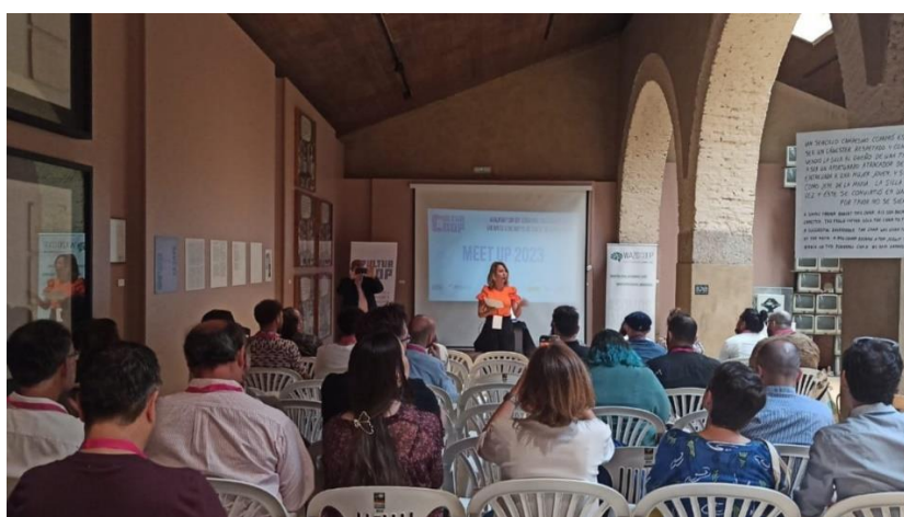
Meet UpCultur COOP 2023

La edición de 2022-23, co-financiada por el Ministerio de Cultura y Deportes del Gobierno de España, incluyó talleres presenciales (talleres de Música Coop, Arte Coop), conciertos didácticos de música social, acciones de sensibilización (conferencias presenciales, podcasts, campañas de sensibilización en RRSS, Guía Cultur COOP 2022), fortalecimiento de redes de cooperación territorial (Red Cultur Coop, Cultur COOP Meet Up) y Diagnóstico Cultur Coop Extremadura 2022.