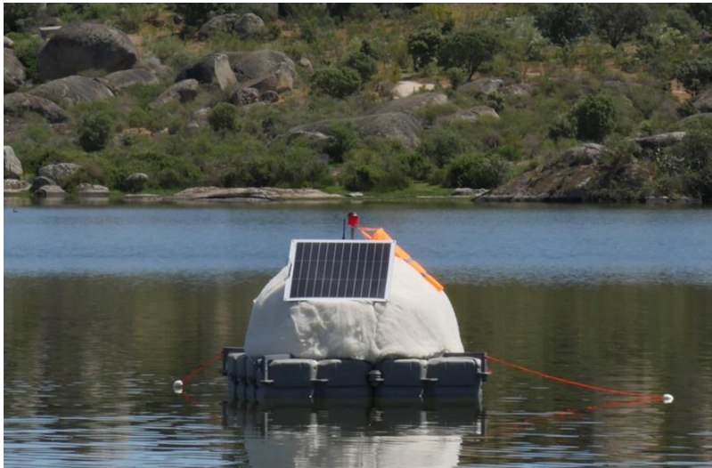
Hidropoéticas de Los Barruecos . Dispositivos de toma de datos en la Charca del Barrueco de Abajo.

Atendiendo a la realidad de sus aguas, el artista planteó una intervención mediante la disposición de dos dispositivos, uno de toma y emisión de datos a tiempo real sobre el agua del lavadero del Museo, conectado a un artefacto de recepción de estos datos manipulables a partir de un theremín, creando así un ambiente audiovisual interactivo en la sala “El Molino” a través de cual, el visitante pudo “comunicarse” con la charca.