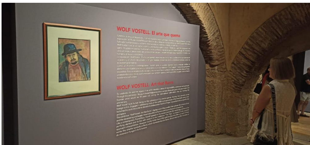
Inauguración de la exposición Wolf Vostell. El arte que quema .

La exposición estuvo vertebrada en torno a la instalación Los Fuegos , perteneciente al ciclo Fluxus Zug (Tren Fluxus). De gran impacto visual, fue puesta en conexión con ejemplos representativos de series emblemáticas del artista que tratan sobre la guerra y la naturaleza como Sara-Jevo (sobre la Guerra de los Balcanes), El muerto que tiene sed (sobre el perpetuo renacer de la naturaleza) o VOAEX. Viaje de (H)Ormigón por la Alta Extremadura (resultado del impacto que produjo en Vostell su primera visita a Los Barruecos en 1974), entre otras obras.