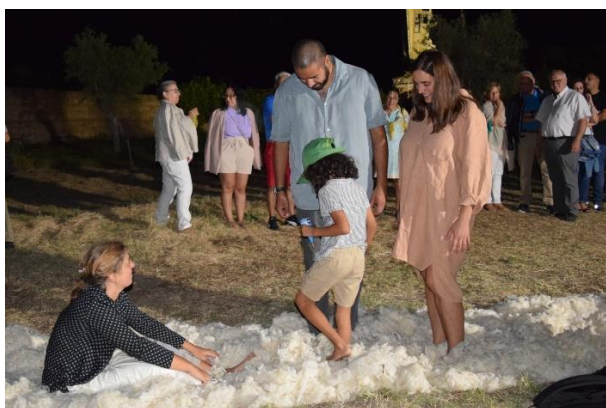
Museo Vostell Malpartida, bajo las estrellas

Evento organizado por la Consejería de Cultura, Turismo y Deportes de la Junta de Extremadura y el Consorcio Museo Vostell Malpartida, con la colaboración del Ayuntamiento de Malpartida de Cáceres, la Asociación de Amigos del Museo y Peninsulares. Cuartos Encuentros Ibéricos de Arte Textil Contemporáneo.