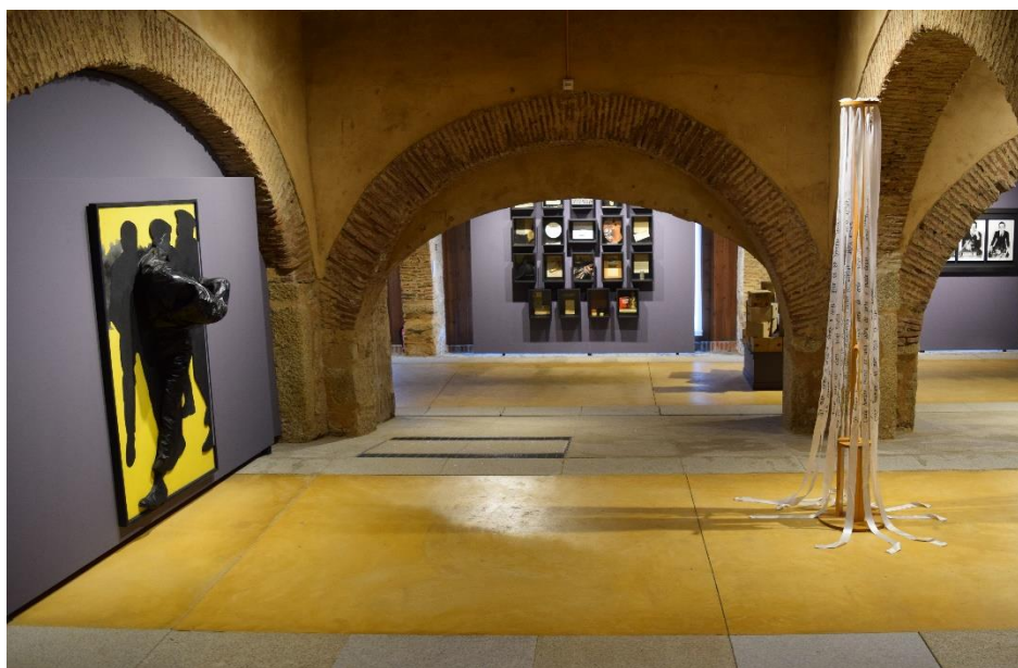
Vista general de la exposición En todas direcciones .