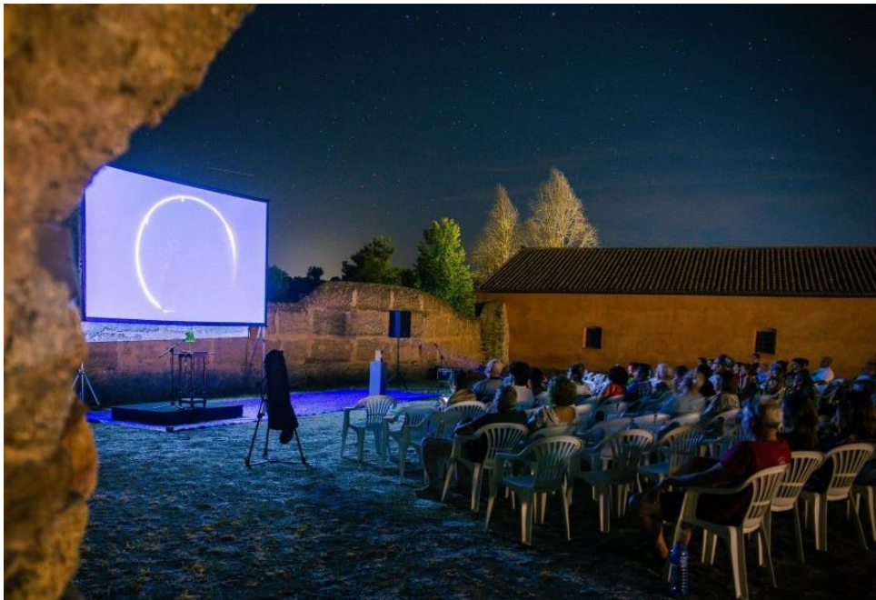
Clausura del Festival Internacional de cine "Periferias".

Además, se entregó el premio Taejo Internacional a la película más votada por el público.