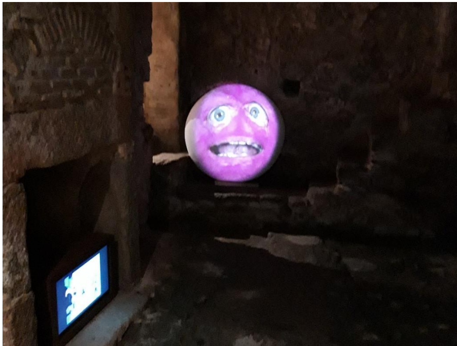
Vista de la exposición Como una llamada a los cuervos en medio del silencio .