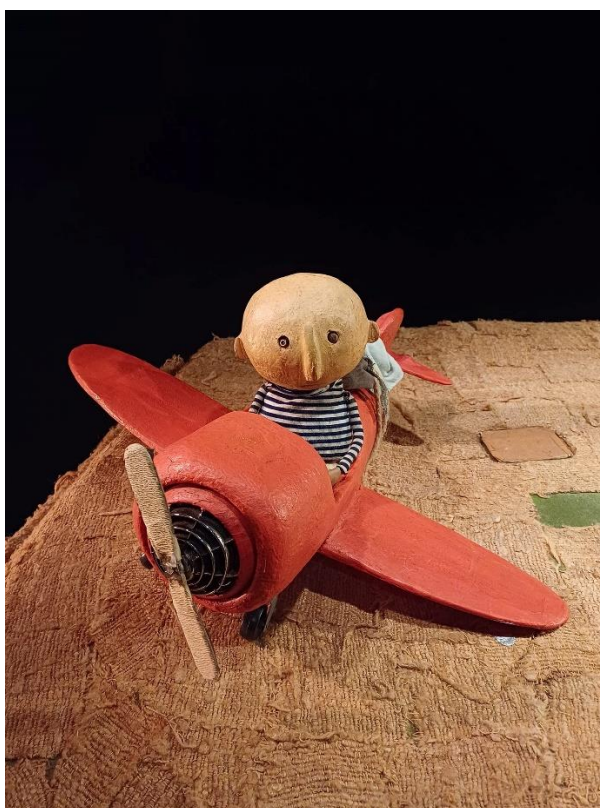
Niño/Nido en el Museo Vostell Malpartida

El espectáculo estuvo financiado por la Asociación de Amigos del Museo Vostell Malpartida, el Consorcio Museo Vostell Malpartida y el Ayuntamiento de Malpartida de Cáceres.