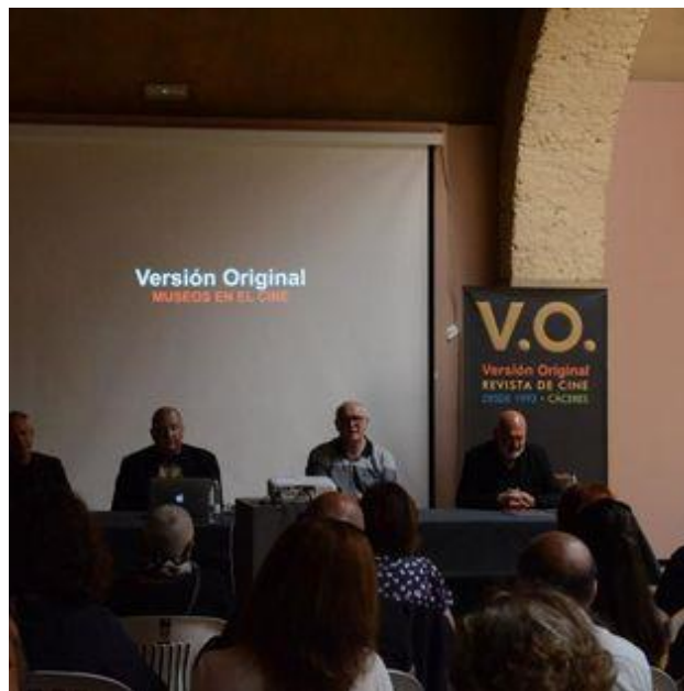
Presentación de la revista Versión Original en el Museo Vostell Malpartida

El número especial de la revista Versión Original dedicado a los museos incluyó recomendaciones de películas donde estos "templos de las musas" tienen una presencia reconocible, junto a textos que reflexionan cómo el séptimo arte ha admirado estos espacios y las obras que albergan.