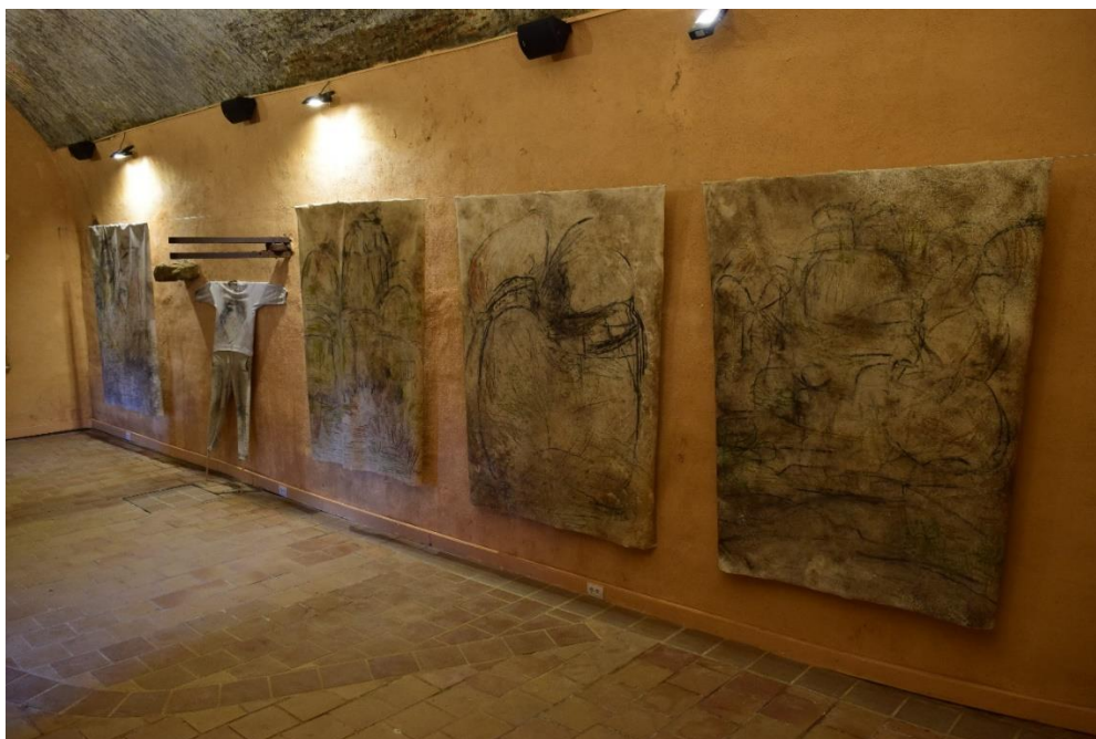
Vista de la exposición de David López Panea Campamento barroco: perlas y bultos

Este "campamento artístico" se inserta dentro de la corriente del arte ecológico y supone, asimismo, una profundización en la investigación que sobre el paisaje viene desarrollando desde hace años el artista con experiencias similares en otros espacios naturales.