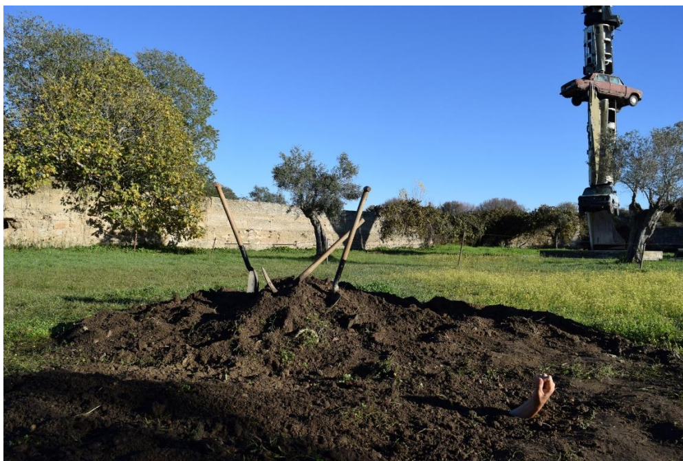
Performance de Mark Shorter en el Museo Vostell Malpartida, Una Mano .

Mark Shorter es un artista australiano. Trabajando en performance , video, fotografía y escultura, examina nuestras preconcepciones sobre el paisaje, el género y el cuerpo. La figura masculina y su condicionamiento es un elemento recurrente en su obra, encontrado tanto en sus propias actuaciones como en los personajes que concibe, que incluyen al vaquero de vodevil Renny Kodgers; el quijotesco viajero Tino La Bamba; y el crítico de arte gutural y temporalmente a la deriva Schleimgurgeln. A menudo absurdamente humorísticos y viscerales, estos personajes son investigaciones de performance . Concebidos para probar la construcción del yo, estiran y retuercen las ideologías que se asientan profundamente en la forma, presionando hasta un punto de distorsión y colapso.